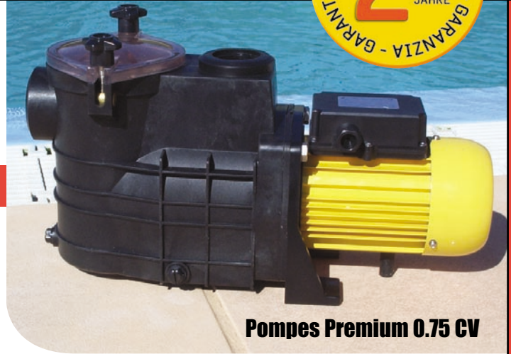
Pompes Premium 0.75 CV

Conformément à la norme C15-100 section 702 publiée par l'Union Technique de l'Electricité, la pompe doit être installée à 3m50 minimum du bassin, avec un interrupteur différentiel de 30 mA. Toute installation non conforme entraîne une annulation de la garantie ainsi que la responsabilité de celui qui a réalisé l'installation. Pour plus d'information se reporter à la notice à l'intérieur du carton.