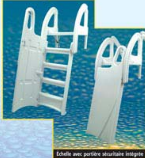
Échelle avec portière sécuritaire intégrée